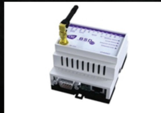
BSD – BSD PLUS