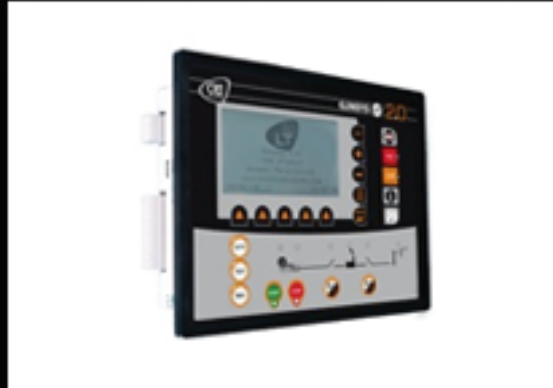
GENSYS 2.0 LT