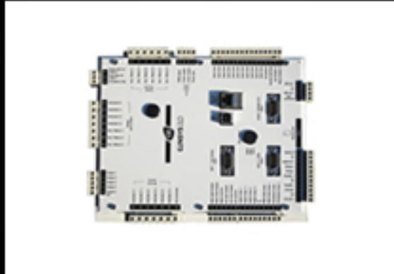
GENSYS 2.0 CORE