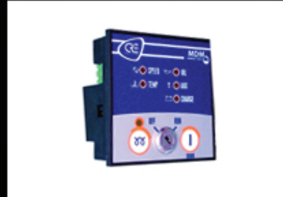
MDM (ARRANQUE MANUAL)